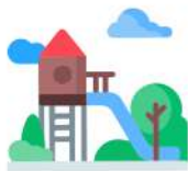
ZONA DE JUEGOS INFANTILES.