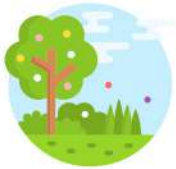
ESPACIOS AJARDINADOS CON ZONAS DE PASEO