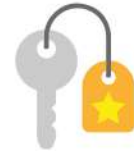
LOCAL COMUNITARIO MULTIUSOS